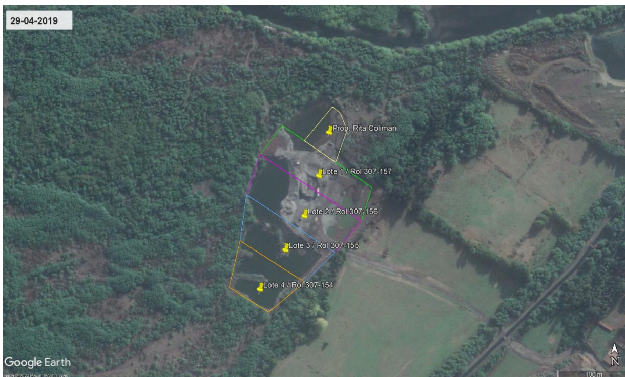
FIGURA 1. UBICACIÓN DEL PROYECTO