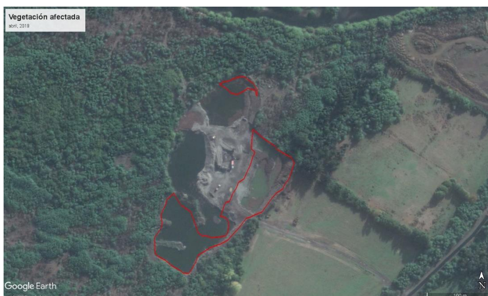
FIGURA 9. IDENTIFICACIÓN DE ÁREA DE VEGETACIÓN AFECTADA. ABRIL, 2019