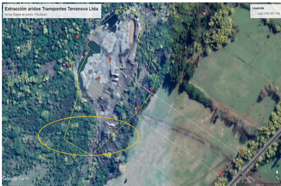
FIGURA 2. EXTRACCIÓN DE ÁRIDOS AL MES DE AGOSTO DE 2018 EN LA UNIDAD FISCALIZABLE