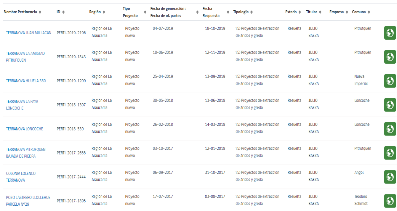
FIGURA 11. CONSULTAS DE PERTINENCIA EFECTUADAS POR LA EMPRESA ANTE EL SEA