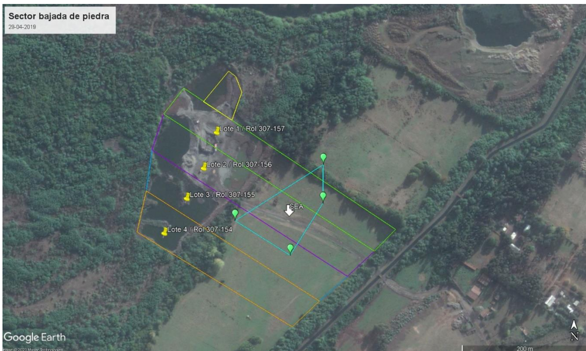
FIGURA 6. POLÍGONO CONSULTADO ANTE EL SEA

Fuente: elaboración propia en base a fotointerpretación de imagen satelital, deslindes de la subdivisión predial informada a través de denuncia ID 57-IX-2019 y consulta de pertinencia del año 2017.