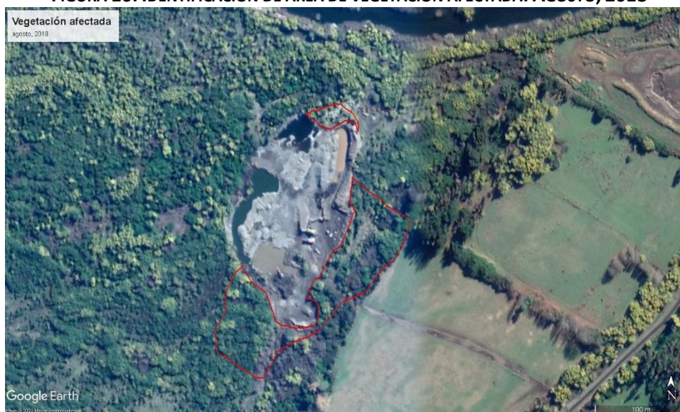
FIGURA 10. IDENTIFICACIÓN DE ÁREA DE VEGETACIÓN AFECTADA. AGOSTO, 2018