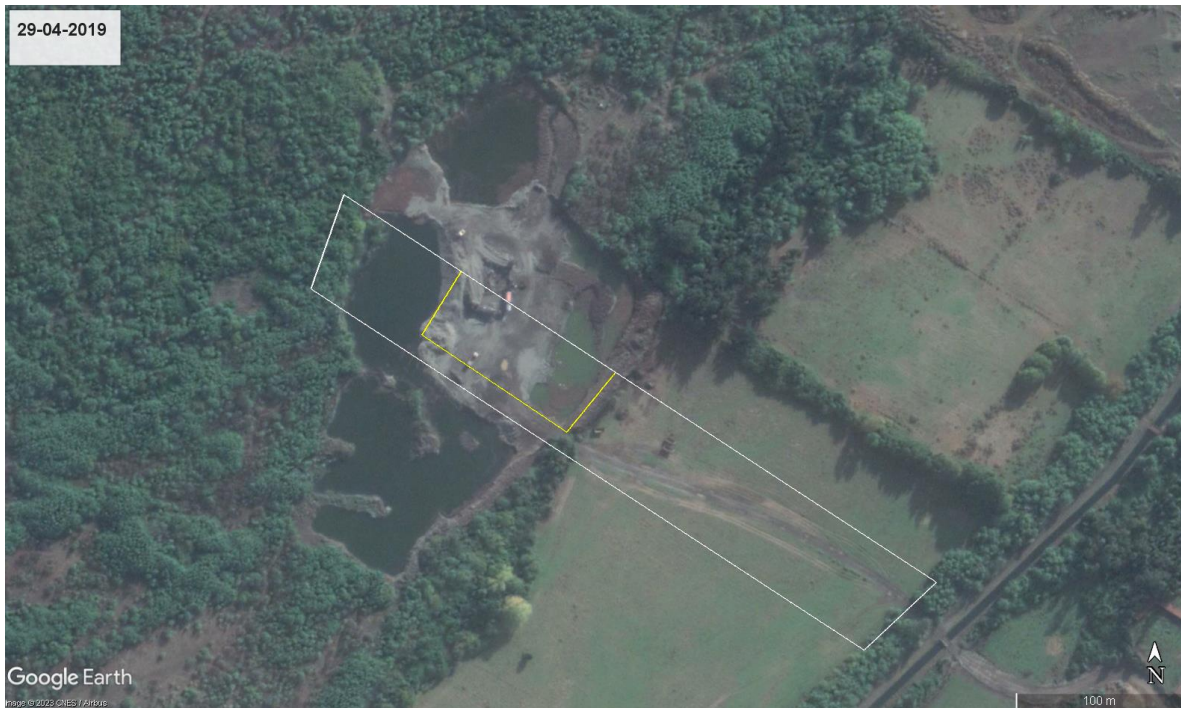
FIGURA 8. EXTRACCIONES EFECTUADAS A ABRIL DE 2019