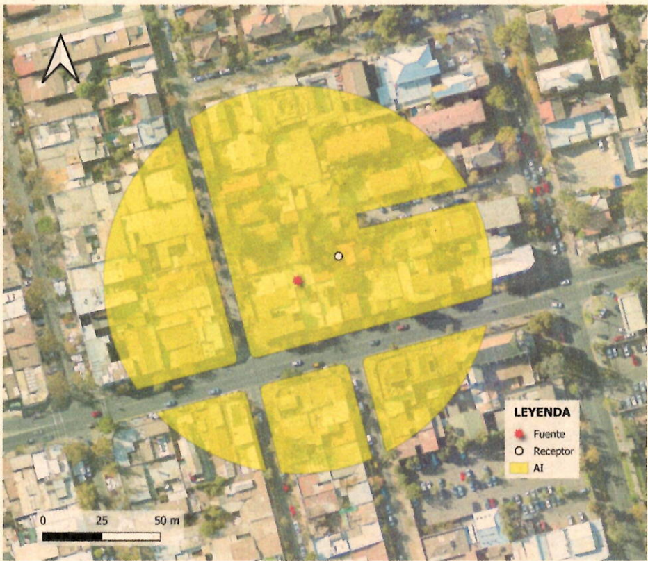
Imagen 1. Intersección manzanas censales y AI