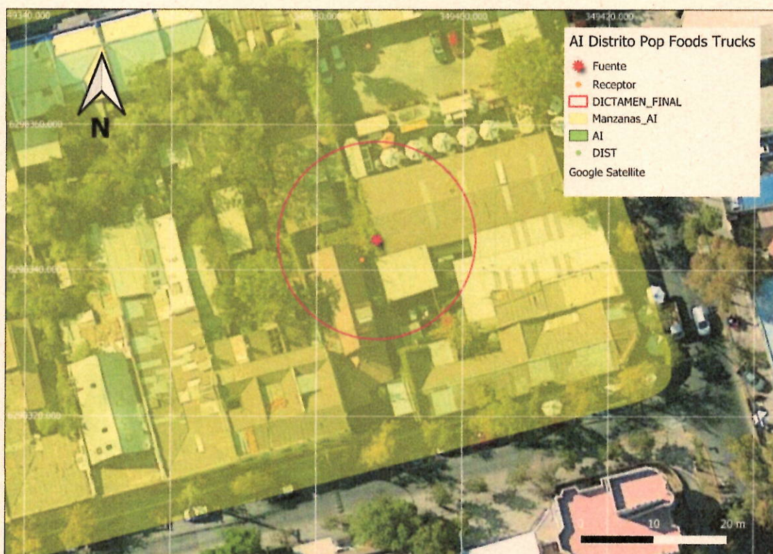
Imagen 1. Intersección manzanas censales y AI