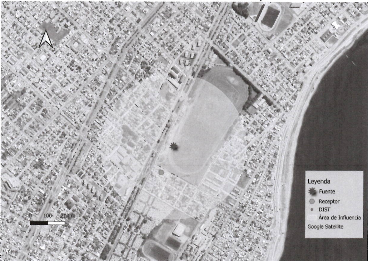
Imagen 1. Intersección manzanas censales y AI