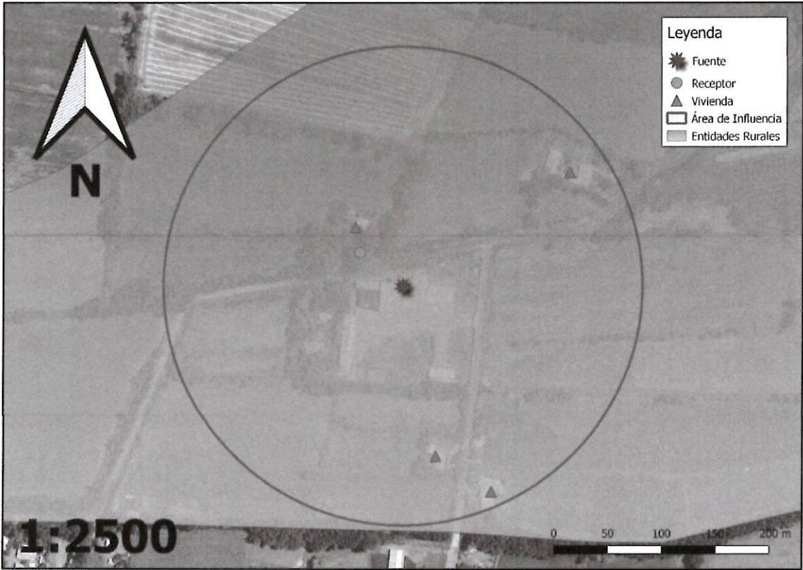
Imagen 1. Intersección manzanas censales y AI