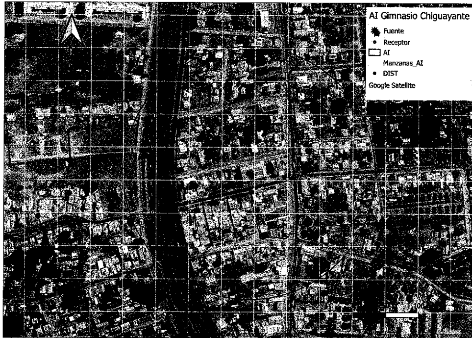
Imagen. Intersección manzanas censales y AI