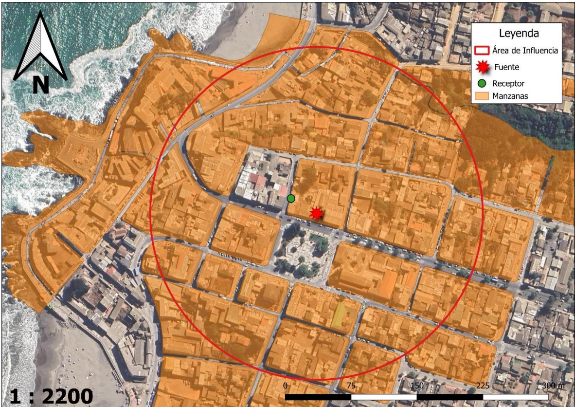
Imagen 1. Intersección manzanas censales y AI