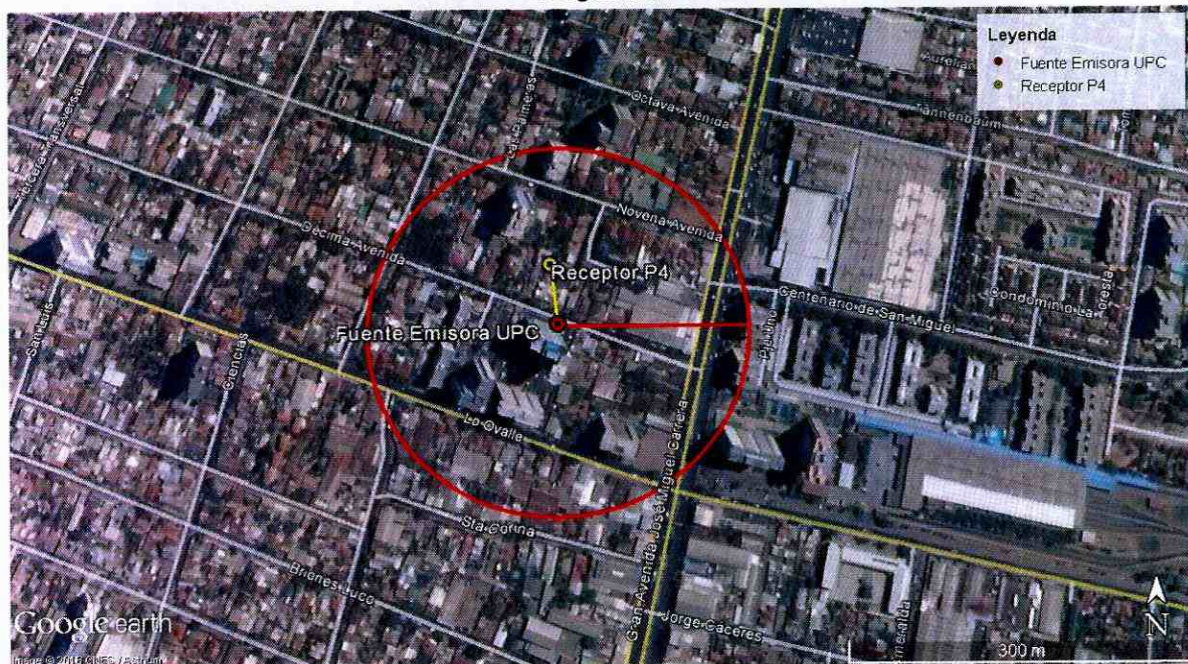
Imagen N° 1