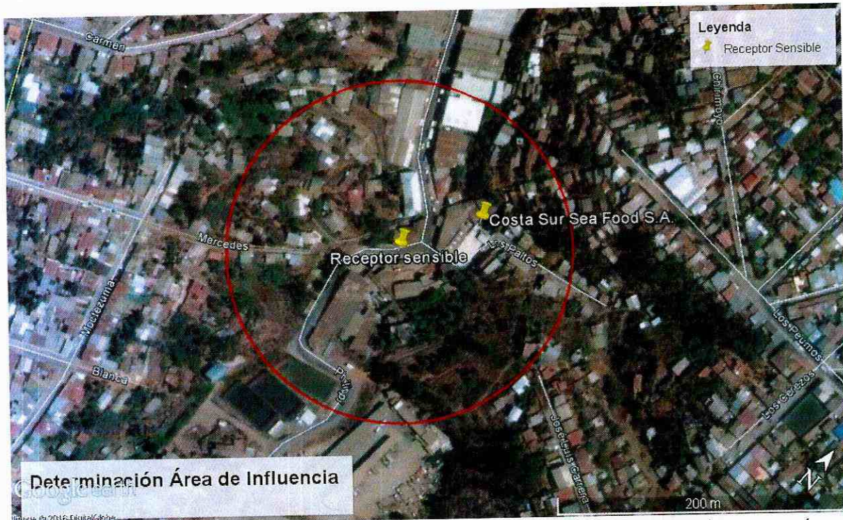
FIGURA 1: DETERMINACIÓN AI DE LA FUENTE DE RUIDO (COSTA SUR SEA FOOD S.A.), EN CONSIDERACIÓN A LA MEDICIÓN REALIZADA EN VISITA INSPECTIVA EN RECEPTOR SENSIBLE (DENUNCIANTE).

73. Posteriormente se procedió a realizar un cruce entre la información obtenida producto de la utilización de la base de datos del Censo del 2002 – sistematizada en el programa Redatam– y el área de influencia determinada previamente. Como resultado de este análisis, se puede señalar que potencialmente se verían afectadas 7 manzanas censales. Las manzanas censales que se identifican son: 5101191006001 con un número total de 563 habitantes, 5101191007019 con un número total de 143 habitantes, 5101191007017 con un número total de 258 habitantes, 5101191007020 con un número total de 2 habitantes, 5101191007021 con un número total de 277 habitantes, 5101191006003 con un número total de 96 habitantes y la manzana censal 5101191006002 con un total de 8 habitantes. Estas manzanas censales han sido consideradas por constituir aquellos sectores con potenciales receptores sensibles a ser afectados por el ruido ocasionado por la industria fuente de ruido.