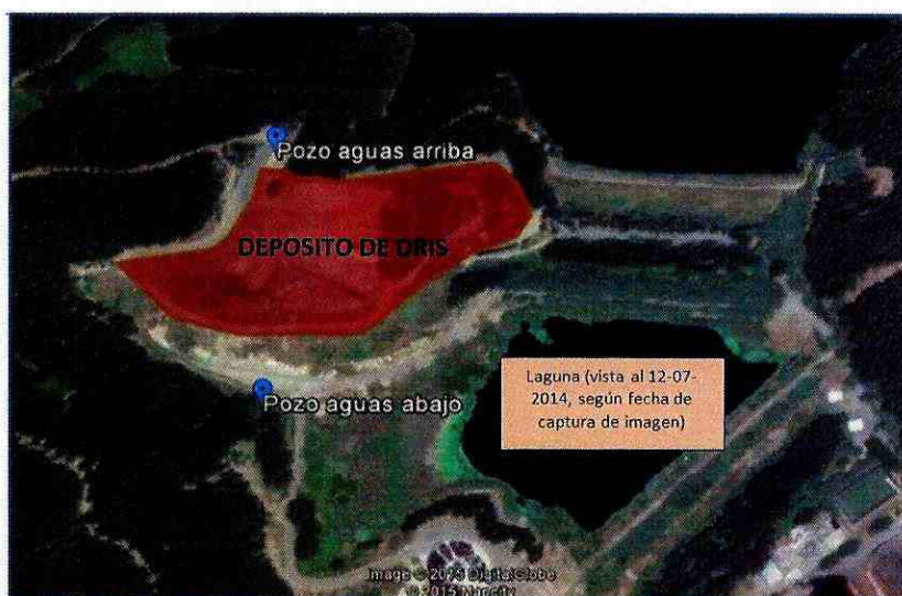
Imagen N°4: Ubicación de los pozos de monitoreo de aguas subterráneas constatados y georreferenciados en terreno, en relación al depósito de DRIS.

170. Considerando lo señalado en el considerando anterior, se planteó la necesidad de evaluar la información asociada a la calidad de aguas subterráneas que ha reportado la empresa a través del sistema de seguimiento ambiental, sin embargo, de acuerdo a la figura 5 del informe DFZ-2015-34-VII-RCA-IA, donde se visualiza la localización de los pozos de monitoreo de aguas subterráneas y su ubicación relativa respecto de la laguna de efluentes, es posible afirmar que el pozo de monitoreo denominado aguas abajo, el que se reporta como AG-02 en los informes de seguimiento revisados (hasta informe correspondiente a 2015, ingresado bajo registro SSA N° 43505, ingresado con fecha 26 de febrero de 2016), no permite comprobar un posible efecto en las aguas subterráneas producto de la existencia de la laguna con algunos sectores que aún tienen aguas acumuladas. Lo anterior debido a que, como se muestra en la figura siguiente, el punto aguas abajo se encuentra ubicado en un sector que podría ser considerado como un punto aguas arriba para efectos de evaluar efectos de la laguna. Al respecto, cabe señalar que de acuerdo a los reportes de seguimiento que realiza la empresa, no se cuenta con información de calidad de aguas subterráneas que representen un punto equivalente a aguas abajo de la laguna y que la empresa tampoco entregó los resultados de monitoreo de aguas subterráneas que habría realizado con ocasión de las obras ejecutadas en relación al sector N° 1 de la laguna.