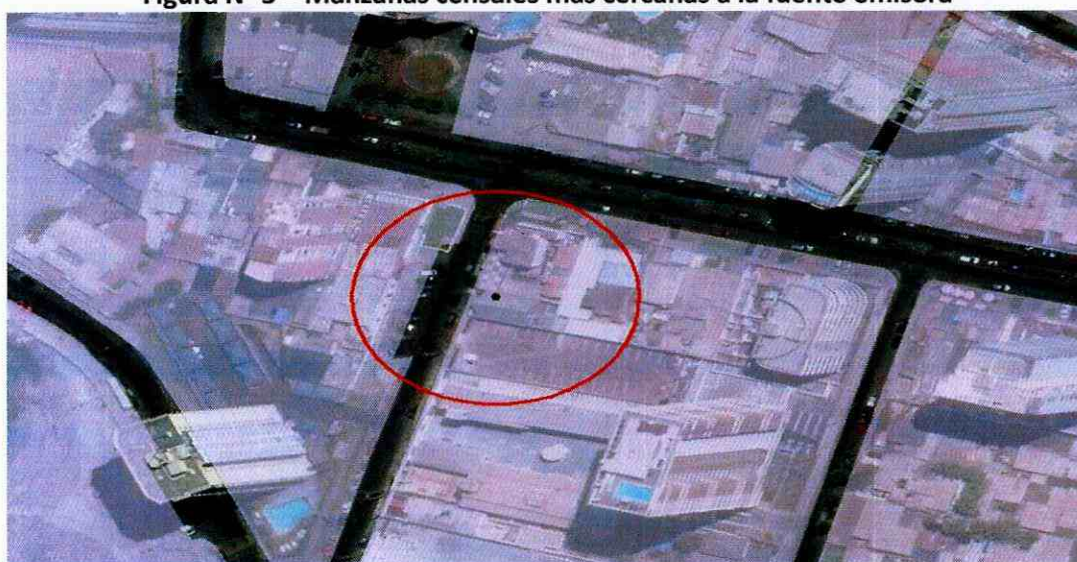
Figura N° 3 – Manzanas censales más cercanas a la fuente emisora

75. En conclusión, la presente circunstancia es aplicable al caso concreto, debido a que, si bien no existen antecedentes que permitan afirmar con