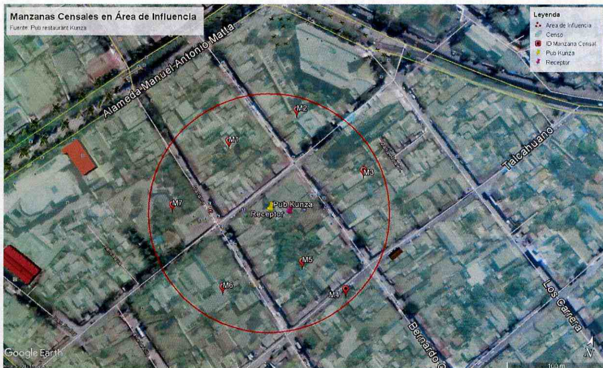
Ilustración 2 Manzanas censales identificadas dentro del Área de Influencia determinada para la fuente de ruido, Pub Restaurant Kunza.

73. Ahora bien, bajo el supuesto que la distribución de la población en cada manzana censal es homogénea y obteniendo la proporción del área de influencia en relación a dichas manzanas censales, se puede señalar que: i) el 60% del área total de la manzana M1 (7.242 m 2 ) se ve influenciada por la fuente de ruido, afectando a un número aproximado de 58 personas; ii) el 20% del área total de la manzana M2 (2.720 m 2 ) se ve influenciada por la fuente de ruido, afectando a un número aproximado de 11 personas; iii) el 40% del área total de la manzana M3 (5.575 m 2 ) se ve influenciada por la fuente de ruido, afectando a un número aproximado de 38 personas; iv) el 10% del área total de la manzana M4 (1.361 m 2 ) se ve influenciada por la fuente de ruido, afectando a un número aproximado de 7 personas, v) el 100% del área total de la manzana M5 (10.777 m 2 ) se ve influenciada por la fuente de ruido, afectando a un número aproximado de 72 personas; vi) el 50% del área total de la manzana M6 (7.254 m 2 ) se ve influenciada por la fuente de ruido, afectando a un número aproximado de 27 personas; vii) el 20% del área total de las manzanas M7 (6.312 m 2 ) se ve influenciada por la fuente de ruido, afectando a un número aproximado de 26 personas. En consecuencia, el número total de personas que se estimó como potencialmente afectadas, que habitan en el buffer delimitado, es de 239.