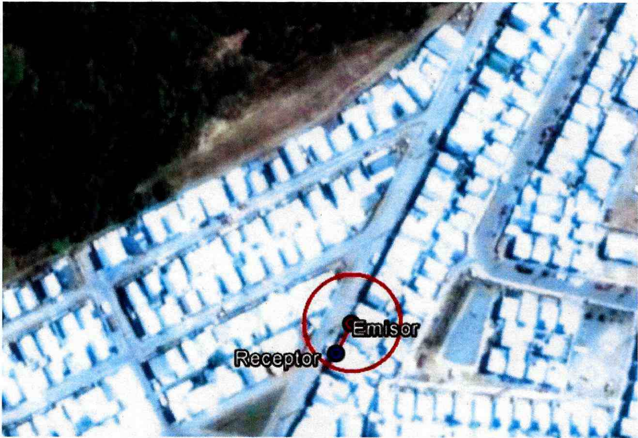
Imagen 1: Determinación del Área de Influencia con un radio de 18 metros. Elaboración propia en base a software Google Earth. En color rojo se puede observar el perímetro del área de influencia determinada para la fuente emisora.