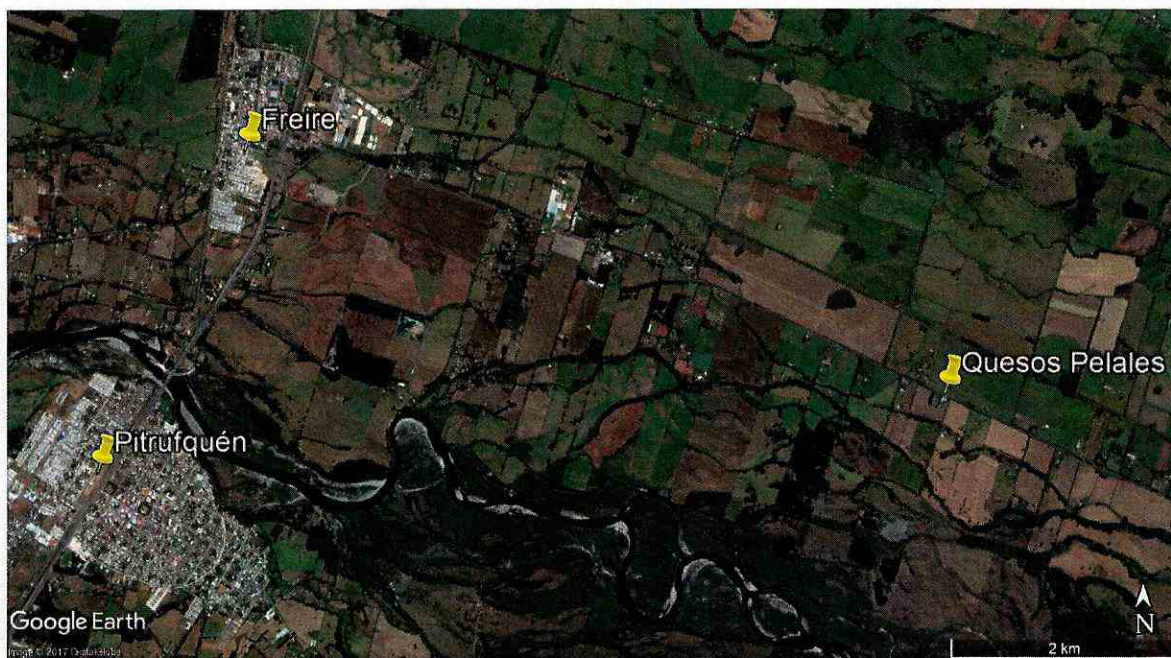
Figura 1. Ubicación del Quesos Pelales. Imagen extraída del programa Google Earth, 2017.

112. De acuerdo al Censo de Población y Vivienda del año 2002 del Instituto Nacional de Estadísticas (INE) ( www.ine.cl ), la población en la comuna de Freire es de 25.514 personas. De acuerdo al Catastro de Bosque Nativo del Servicio de Mapas del Sistema Nacional de Información Ambiental (SINIA) 17 , el uso de suelo de esa área corresponde a “rotación cultivo-pradera”.