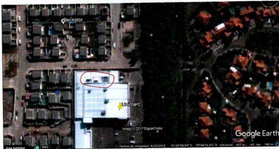
Imagen N° 1. Se destaca en un círculo los equipos de aire acondicionado y motores de cámaras de frío de la azotea del Supermercado Unimarc de Pedro Fontova N°7626, Huechuraba, el día 15 de abril de 2012.

79. Respecto a los elementos de la azotea señalados anteriormente, el acta de inspección señala que "(...) el ruido medido correspondió al funcionamiento de equipos de aire acondicionado y motores de cámaras de frío ubicados en la azotea de la actividad "Supermercado Unimarc", ubicado en Pedro Fontova N°7626, comuna de Huechuraba"