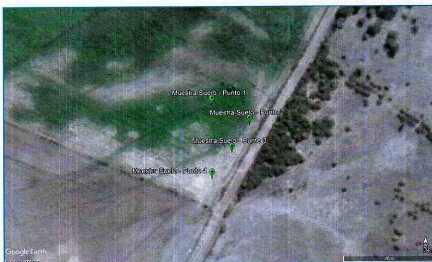
Figura 1: Puntos de muestreos, imagen satelital con fecha 28 de marzo de 2017, extraída del programa Google Earth.

152. El objetivo de la campaña de muestreo fue establecer si los suelos expuestos al riego del efluente tratado por la planta de tratamiento de Alifrut-Chillán, revelan un contenido de parámetros desigual entre ellos, acentuando el análisis en el contenido de sodio total, y determinar la importancia del riesgo.