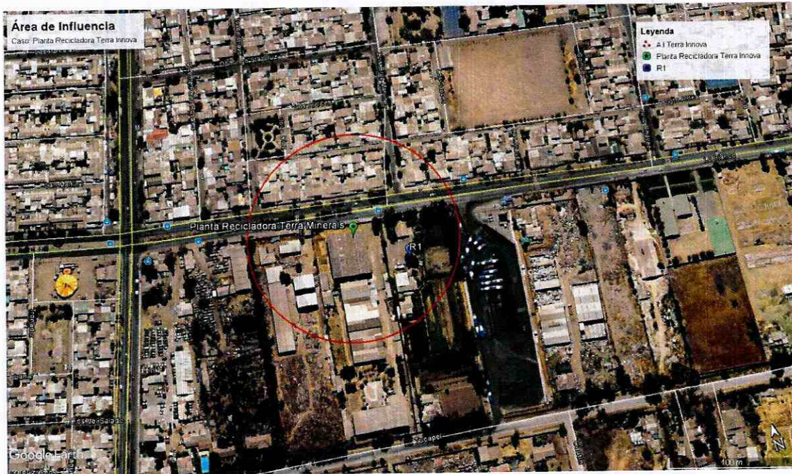
Ilustración 1 Determinación del Área de Influencia con un radio de 89 metros. Elaboración propia en base a software Google Earth. En color rojo se puede observar el perímetro del área de influencia determinada para la fuente "Planta Recicladora Terra Innova Chile S.A."

90° De este modo, se determinó un Área de Influencia o Buffer cuyo centro corresponde al domicilio de la fuente emisora que fue determinado mediante las coordenadas geográficas indicadas en el Acta de Fiscalización de fecha 14 de diciembre de 2015, con un radio de 89 metros aproximadamente, circunstancia que se grafica en la siguiente imagen.