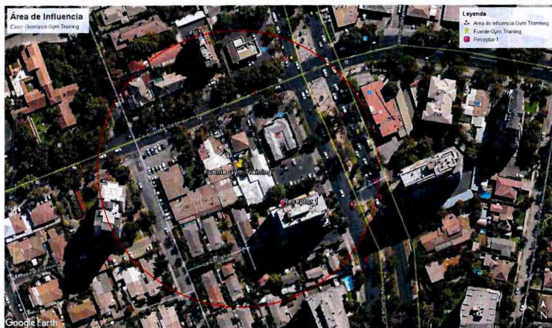
Ilustración 1 Determinación del Área de Influencia con un radio de 90 metros. Elaboración propia en base a software Google Earth. En color rojo se puede observar el perímetro del área de influencia determinada para la fuente "Gym Training"

130. Una vez determinada el AI, se procedió a interceptar dicha información con los datos contenidos en el software Radatam, el que integra la base de datos del Censo del año 2002, con información georreferenciada respecto a las manzanas censales. En base a ello, se identificó que el AI intercepta 4 manzanas censales.