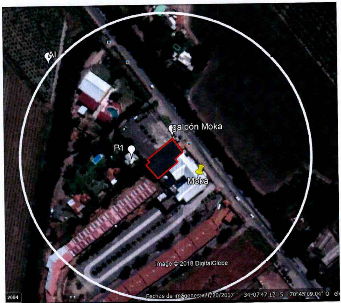
Figura 3. Área de Influencia Discoteque Moka. El círculo blanco representa el perímetro del área de influencia de 140 metros; P1 es receptor sensible, en rojo se muestra el perímetro del galpón de Moka. Elaboración propia en base a software Google Earth.

127. Así, en base a lo expuesto en el considerando anterior, se estimó que la propagación sonora en campo libre para el nivel de ruido registrado en el punto P1, se encuentra a una distancia de 140 metros desde la fuente, en donde el ruido alcanza el nivel de cumplimiento de la norma según el D.S. N° 38/2011.