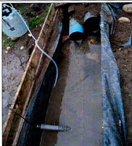
Fotografía N° 2 Equipo instalado

89. De esta manera, los resultados del informe de terreno, incorporados al informe DFZ-2015-1120-VIII-NE-EI, no permiten tener por configurada la infracción, considerando especialmente que: