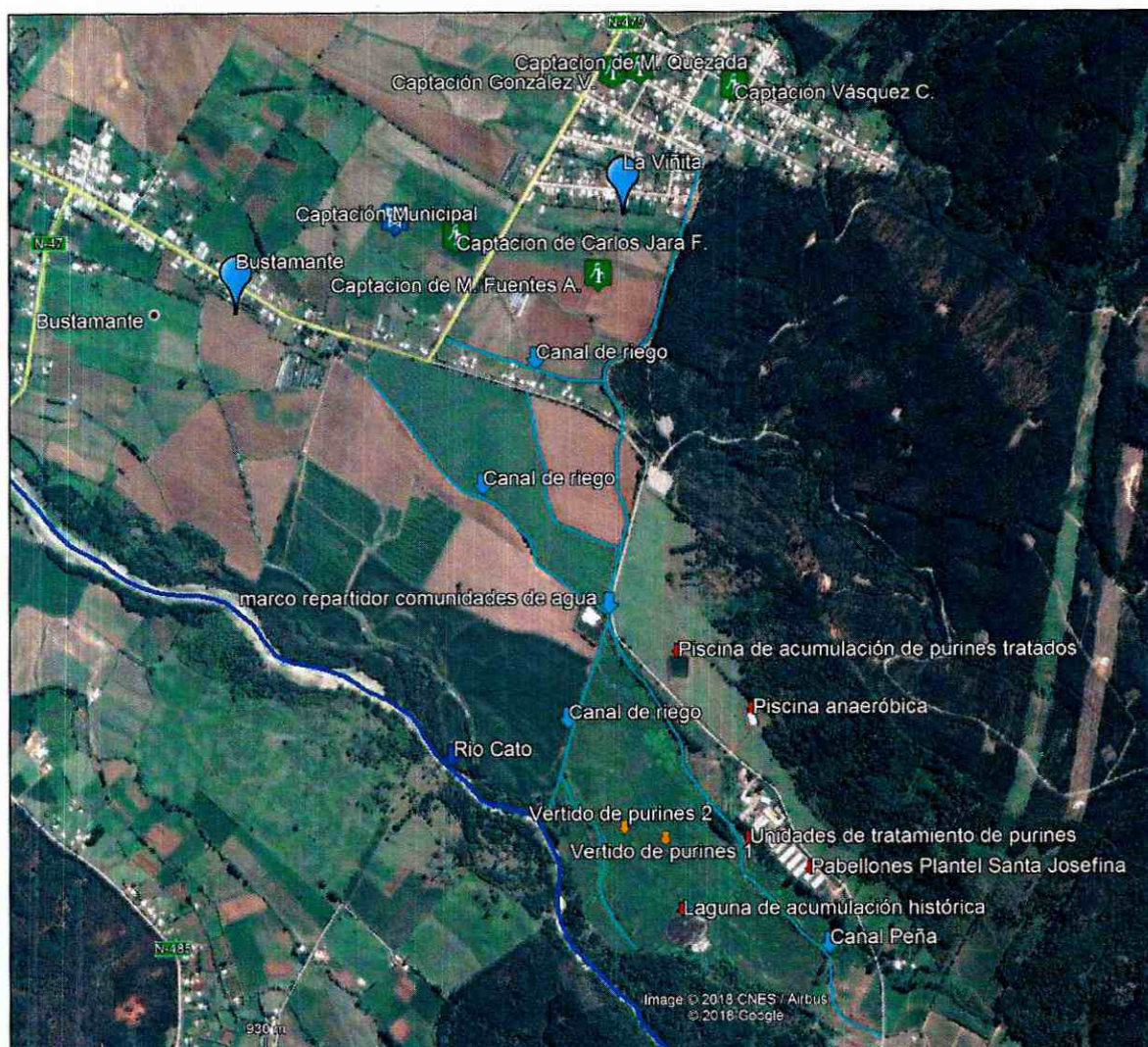
Figura 1. Contexto del proyecto.

118. Respecto al suministro de agua potable para la población, según el PLADECO de Coihueco (2008 – 2012), las localidades de Bustamante y La Viñita, en el centro urbano de Bustamante y de La Viñita, la cobertura del sistema de agua potable es del 100%, abasteciendo a 1814 personas a través de un sistema de Agua Potable Rural (APR), cuyas fuentes de captación corresponden a sondajes de agua subterránea.