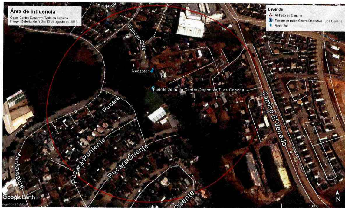
Ilustración 3 Imagen satelital, publicada en software Google Earth, de fecha 12 de agosto de 2014, que muestra trazado urbano existente en el área de influencia, durante el año 2014, luego de la medición de ruidos validada por esta Superintendencia.

106. De la mencionada geo-visualización, se pudo observar que el tejido urbano edificado en los alrededores de la fuente de emisión de ruido, corresponde principalmente a un área residencial. De la distribución espacial de área identificada, se puede visualizar que alrededor de la fuente de emisora de ruido se encuentran los receptores sensibles, en relación a las emisiones nocturnas de la fuente. Dentro del área de influencia de la fuente, de manera particular en el área identificada como residencial (no se consideraron para este análisis los sectores en donde se identifican Establecimientos Educacionales), mediante la geo-visualización se pudieron identificar alrededor de 163 hogares. Del mismo modo, de manera de cuantificar la cantidad de personas potencialmente afectadas por la Centro Deportivo Todo es Cancha, se consideró que el número medio de personas por hogar registrado en el Censo del 2002, es de 3,6 personas 28