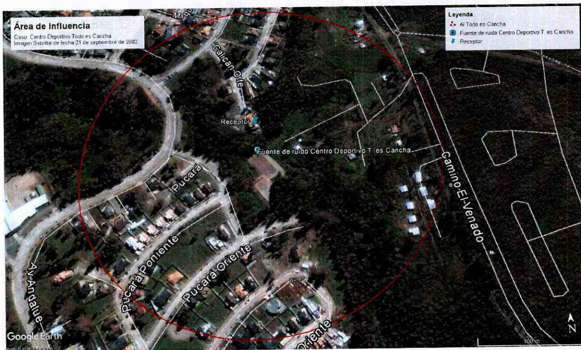
Ilustración 2 Imagen Satelital, publicada en software Google Earth, de fecha 21 de septiembre de 2002, que muestra el trazado urbano existente en el área de influencia, durante el año del Censo de 2002.

comparativo, observando el trazado urbano en dos imágenes satelitales correspondiente a los años 2002 y 2014. En dicho análisis comparativo, se observó que el trazado urbano ha cambiado significativamente a través del tiempo en el área de influencia determinada, y en las proximidades de la ubicación de la fuente, lo que da cuenta de que la utilización de la información del Censo de 2002, no representa la realidad urbana existente durante la fecha de la medición de ruido validado por esta Superintendencia, a saber 7 de julio de 2014, y que al utilizarla se subestimaría de manera significativa el número de personas afectadas por las emisiones de ruido generadas por la fuente.