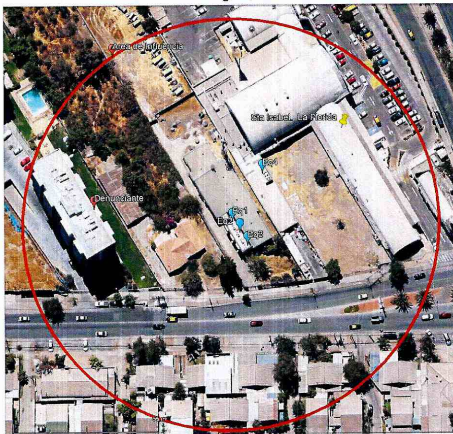
Imagen N° 2. Área referencial de casas consideradas en el área de influencia (AI) de la fuente de ruido de Supermercado Santa Isabel de Avenida La Florida para la determinación del número de personas que pudo ser afectada.