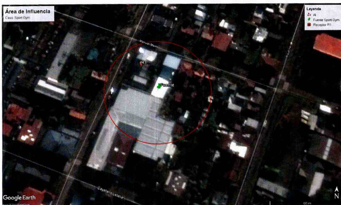
Ilustración 1 Determinación del Área de Influencia con un radio de 46 metros. Elaboración propia en base a software Google Earth. En color rojo se puede observar el perímetro del área de influencia determinada para la fuente "Sport Gym".

112. De este modo, se determinó un Área de Influencia o Buffer cuyo centro corresponde al domicilio de la fuente emisora que fue determinado mediante las coordenadas geográficas indicadas en el Acta de Fiscalización de fecha 12 de mayo de 2017, con un radio de 46 metros aproximadamente, circunstancia que se grafica en la siguiente imagen: