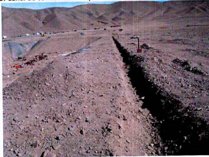
Imagen N°5: Canal de contorno sin impermeabilización ni cubierto con shotcrete