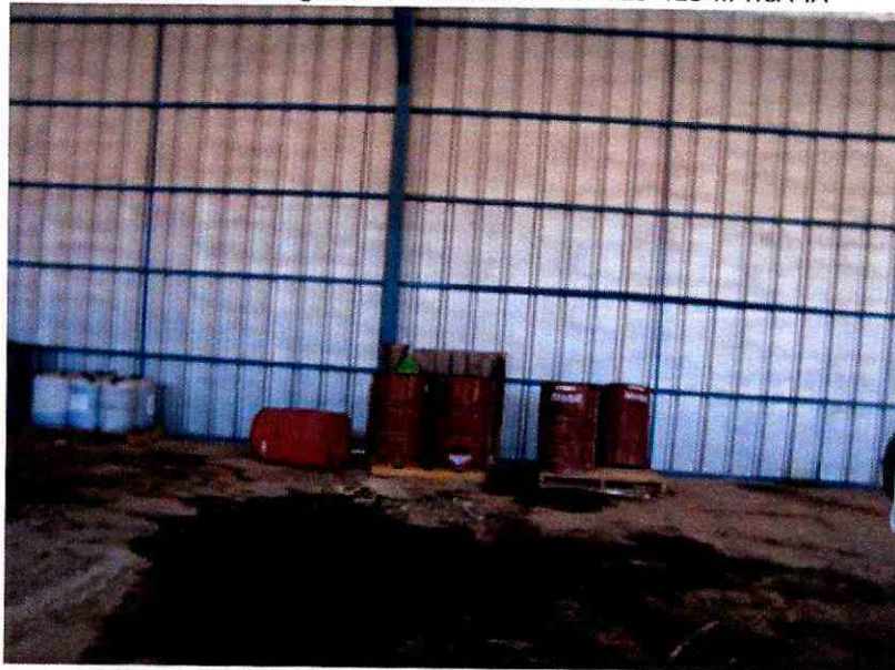
Imagen N°2: Fotografía N° 3 informe DFZ-2013-418-III-RCA-IA

97. Así, en la fotografía N° 3, del informe previamente indicado, se constató la presencia de una mancha de color negro en la superficie del galpón, lo que se debería a derrame de hidrocarburos. Este aspecto se relaciona con la letra a) de la infracción: