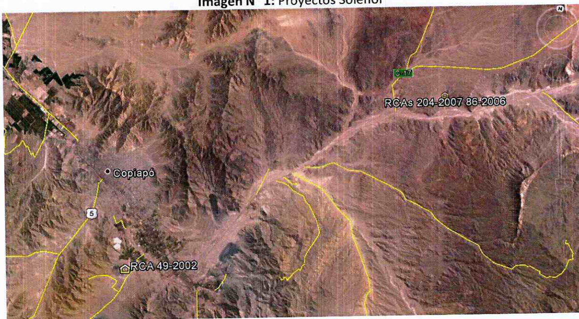
Imagen N° 1: Proyectos Solenor

6. A su vez, las instalaciones correspondientes a los proyectos calificados ambientalmente favorables por las RCA N°86/2006 y RCA N°204/2007 se ubican específicamente, en Quebrada de Paipote, a 28 kilómetros desde la ciudad de Copiapó, a 4 kilómetros desde la intersección del Camino internacional C-31 (camino a la mina Coipa) con el camino a Diego de Almagro C-17, por el camino internacional C-31.