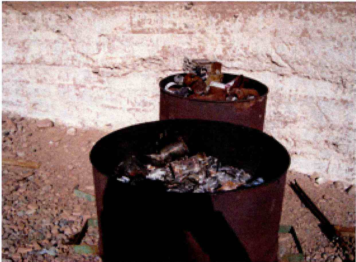
Imagen N°7: Fotografía N°1 informe DFZ-2013-418-III-RCA-IA

143. Esta situación, fue verificada en la inspección ambiental, mediante fotografías que evidencian la incineración de residuos sólidos: