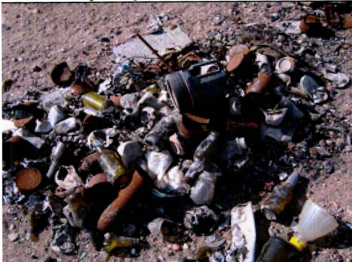
Imagen N°8: Fotografía N°2 informe DFZ-2013-418-III-RCA-IA