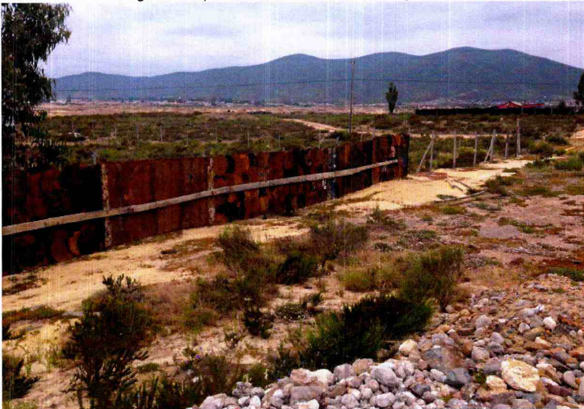
Imagen N°5: Disposición de los tambores como cerco perimetral.