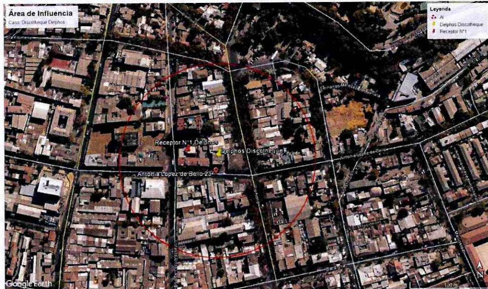
Ilustración N° 2

Ilustración 1 Determinación del Área de Influencia con un radio de 126 metros. Elaboración propia en base a software Google Earth. En color rojo se puede observar el perímetro del área de influencia determinada para la fuente "Discoteque Delphos"