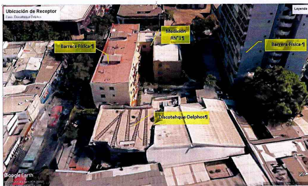
Ilustración N° 1

Ubicación del punto de medición durante la Fiscalización y el contexto constructivo del sector. Elaboración propia en base a software Google Earth.