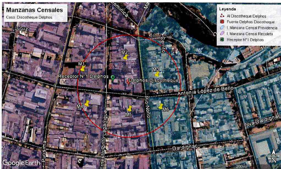
Manzanas censales identificadas dentro del Área de Influencia determinada para la fuente de ruido, "Discoteque Delphos".

157. En conclusión, si bien no existen antecedentes que permitan afirmar con certeza que existan personas cuya salud se vio afectada producto de la actividad generadora de ruido, sí existen antecedentes de riesgo respecto al número de potenciales afectados, es decir, de personas cuya salud podría haberse visto afectada por la ocurrencia de la infracción.