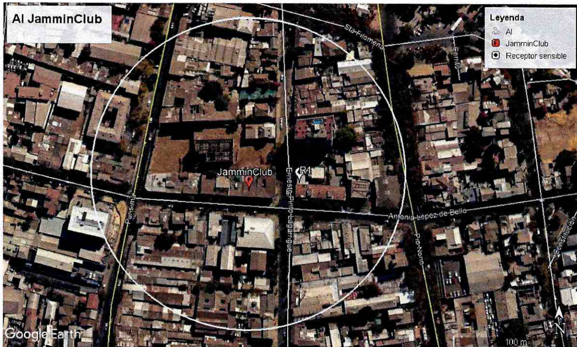
Figura 1. Determinación del Área de Influencia con un radio de 126 metros. Elaboración propia en base a software Google Earth. La circunferencia indica el perímetro del área de influencia determinada para la fuente "Jammin' Club" y el receptor sensible identificado como R1 ubicado en Ernesto Pinto Lagarrigue 129, Recoleta.

120. Una vez determinada el AI, se procedió a interceptar dicha información con los datos contenidos en el software Radatam, el que integra la base de datos del Censo del año 2017, con información georreferenciada respecto a las manzanas censales. En base a ello, se identificó que el AI intercepta 7 manzanas censales.