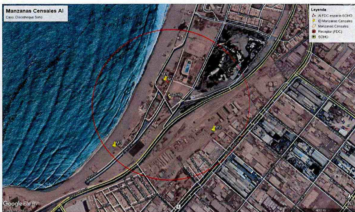
Ilustración 2 Manzanas censales identificadas dentro del Área de Influencia determinada para la fuente de ruido, "Discotheque Soho".

114. En consecuencia, de acuerdo a lo presentado en la tabla 6, el número de personas que se estimó como potencialmente afectadas por la fuente emisora, que habitan en el buffer identificado como AI, es de 232 personas.