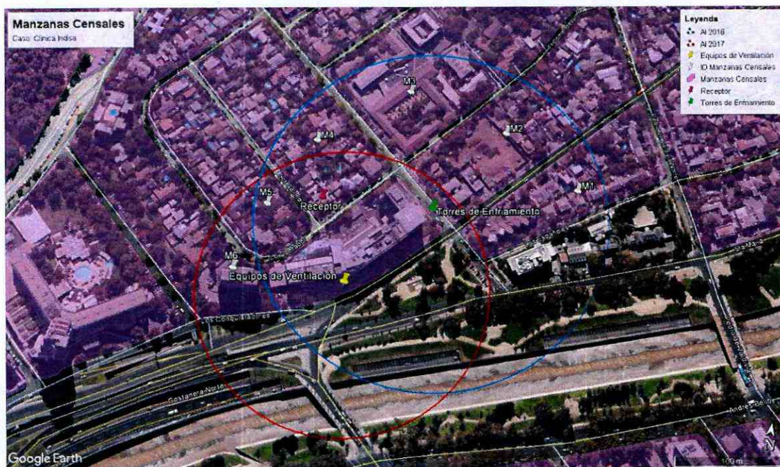
Ilustración 2 Manzanas censales identificadas dentro del Área de Influencia determinada para la fuente de ruido, "Clínica Indisa".

137. En consecuencia, de acuerdo a lo presentado en la tabla 6, el número de personas que se estimó como potencialmente afectadas por la fuente emisora, que habitan en el buffer identificado como AI, es de 331 personas.