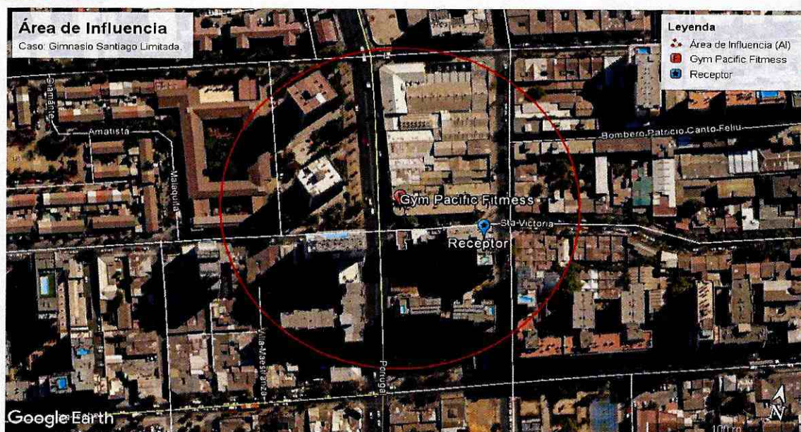
Ilustración 1 Determinación del Área de Influencia con un radio de 114 metros. Elaboración propia en base a software Google Earth. En color rojo se puede observar el perímetro del área de influencia determinada para la fuente "Gym Pacific Portugal".

97. Una vez obtenida el Área de Influencia de la fuente, se procedió a interceptar dicho buffer, con la información georreferenciada del Censo 2017. Dicha información de carácter público, consiste en una cobertura de las manzanas censales 28 de cada una de las comunas, de la Región Metropolitana 29 . Para la determinación del número de personas existente en el Área de Influencia, se utilizó el indicador de la base de datos Censal, "número de personas", el que da cuenta del número de personas total existente de cada una de las manzanas censales de la Región Metropolitana, de acuerdo al Censo 2017. Ahora bien, en el caso particular del Área de Influencia de la fuente Gimnasio Pacific Portugal, se identificó que dicha área de influencia intercepta 7 manzanas censales.