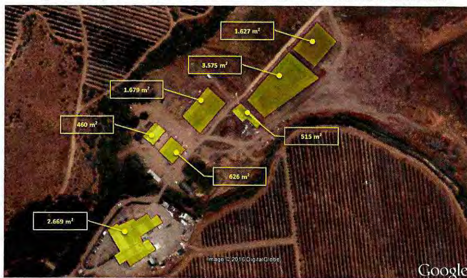
Figura 3: superficie total de cada una de las instalaciones detectadas.

Fuente: Informe de Fiscalización rol DFZ-2016-1081-VII-RCA-IA, figura 9. Imagen satelital Google Earth, donde se puede apreciar las zonas construidas y sus respectivas superficies conforme al análisis espacial efectuado, utilizando una imagen satelital de fecha 29-12-2015.