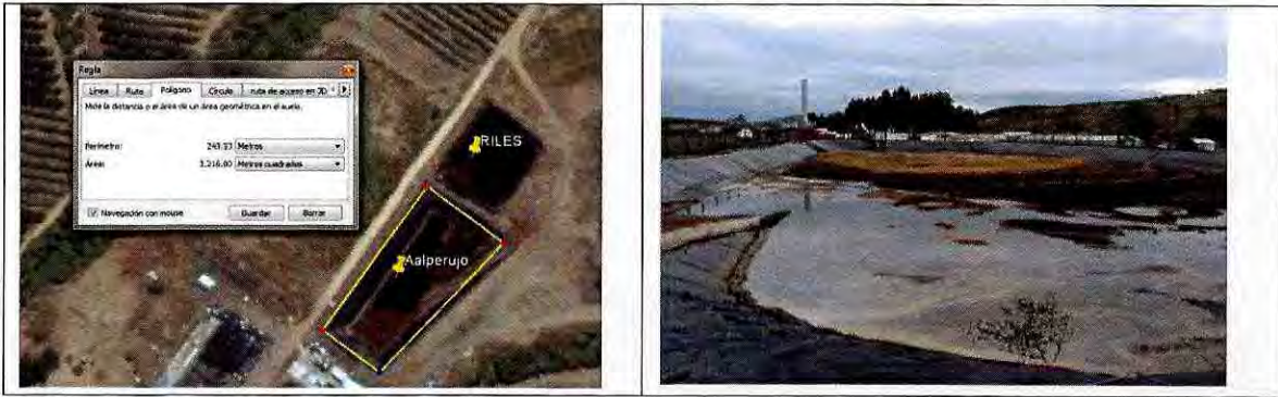
Figura 7. Imagen satelital de la piscina de almacenamiento de alperujo y su superficie estimada de 12.500 m 3 . Al costado derecho, imagen de la piscina tomada en la inspección de 2015.