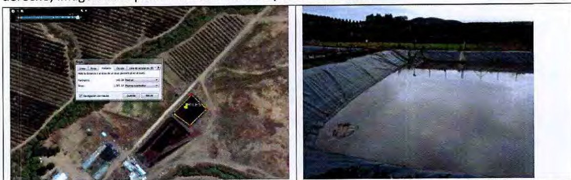
Figura 4. Imagen satelital, de la piscina de riles y su superficie aproximada de 4.500m 3 . Al lado derecho, imagen de la piscina tomada en la inspección de 2015.