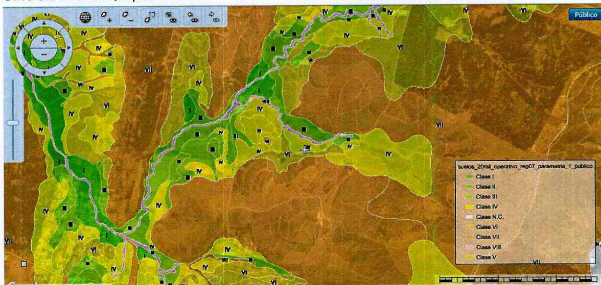
Figura 6. Identificación de clase de uso de suelo del sector donde se inserta la Planta de aceite de Oliva olivares de Quepu.