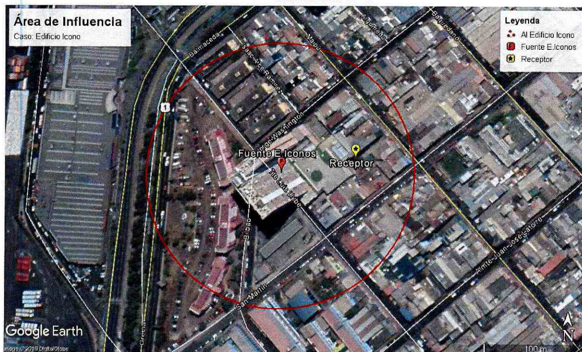
Ilustración 1. Determinación del Área de Influencia con un radio de 77 metros. Elaboración propia en base a software Google Earth. En color rojo se puede observar el perímetro del área de influencia determinada para la fuente "Edificio Ícono".

106. Una vez obtenida el Área de Influencia de la fuente, se procedió a interceptar dicho buffer, con la información georreferenciada del Censo 2017. Al respecto, se hace presente que dicha información de carácter público, consiste en una cobertura de las manzanas censales 30 de cada una de las comunas de la Región Antofagasta 31 .