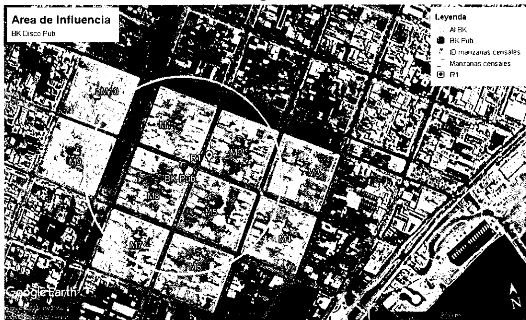
Figura 1. Al interior del círculo de color blanco que determina el área de influencia de BK Disco Pub, se muestran en color verde agua las áreas de las manzanas censales interceptadas.

103. Una vez determinada el AI, se procedió a interceptar dicha información con los datos de densidad de población y vivienda por manzana censal 34 del Censo 2017, para la comuna de Punta Arenas, disponibles en el portal del Instituto Nacional de Estadísticas. En base a ello, se identificó que el AI intercepta 10 manzanas censales, tal como se muestra en la Figura 1, como M1 a M10 y se describe en la Tabla N°5, indicando: ID definido para el presente procedimiento sancionatorio (ID PS), ID correspondiente a la manzana censal, área aproximada de toda la manzana censal en m 2 , número de personas dentro de la manzana censal y Área de Influencia de la fuente de ruido.