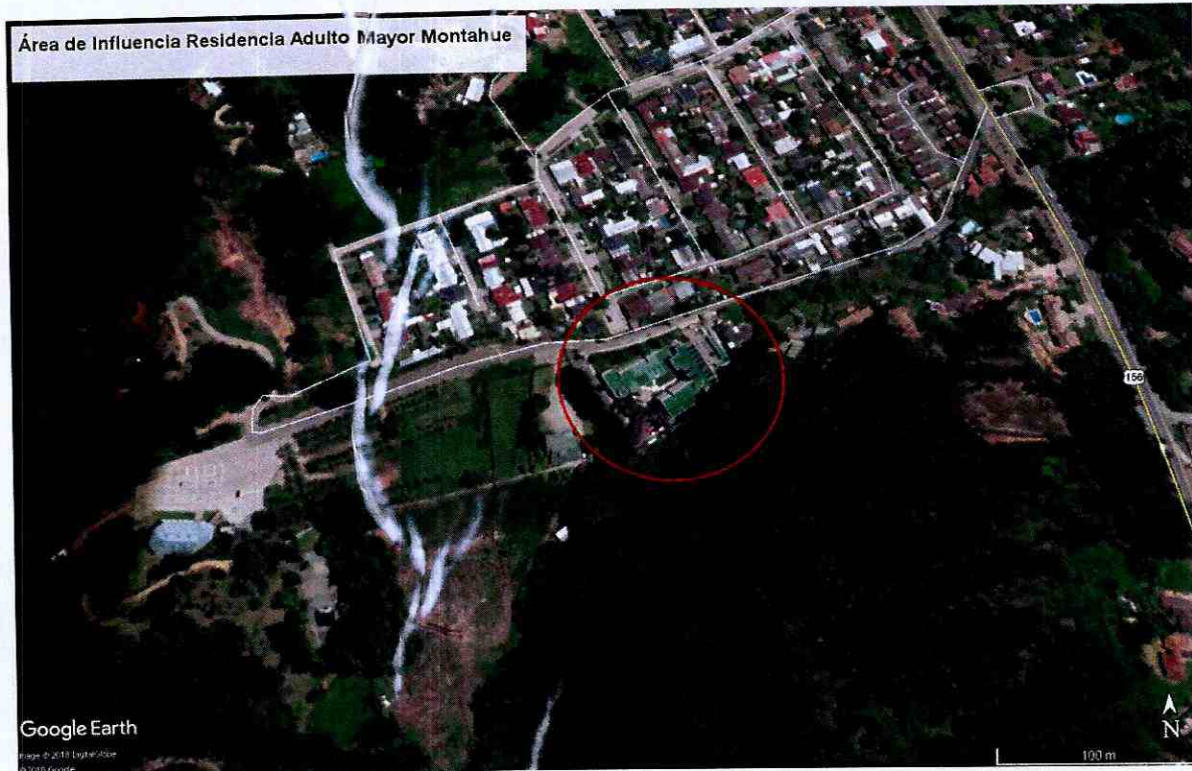
Imagen N° 1. Determinación de Área de Influencias con un radio de 64 metros en base a la fuente “equipos de calefacción”. Elaboración propia en base a software Google Earth. En color rojo se puede observar el perímetro del área de influencia determinada para la fuente “Residencia Adulto Mayor Montahue”.

101. De este modo, se determinó un Área de Influencia (“AI”), o Buffer, cuyo centro en este caso, corresponde al punto medio del edificio principal ubicado en Camino Vecinal Montahue N° 245, San Pedro de la Paz, Región del Biobío, según se expresa en el acta de fiscalización de 19 de mayo de 2017, con un radio de 64 metros aproximadamente, circunstancia que se grafica en la siguiente imagen.