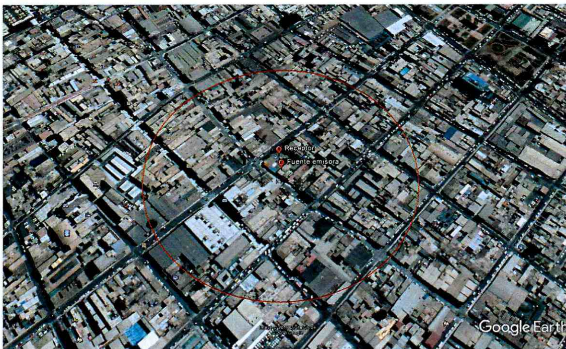
Imagen N° 1 Determinación del Área de Influencia con un radio de 170 metros. Elaboración propia en base a software Google Earth. En color rojo se puede observar el perímetro del área de influencia determinada para la fuente Bar Restaurant "La Posta"

119. Una vez obtenida el Área de Influencia de la fuente, se procedió a interceptar dicho buffer, con la información georreferenciada del Censo 2017. Al respecto, se hace presente que dicha información de carácter público, consiste en una cobertura de las manzanas censales 31 de cada una de las comunas de la Región de Arica y Parinacota 32 .