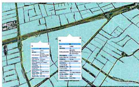
Imagen N° 3: Propuesta de manzanas censales afectadas por fuente Club Palestino

133. Ahora bien, en el caso particular del AI de la fuente Club Palestino, se identificó que dicha AI intercepta un número excesivo de manzanas censales, que no se condicen con la realidad de la existencia de: 1) la avenida Kennedy; 2) la avenida Las Condes; 3) mall Alto Las Condes; cuyas presencias restringen el área de influencia directa de la fuente en análisis. Al respecto, planteando un escenario conservador en cuanto al alcance de las emisiones de ruido del Club Palestino, se estima razonable que se identifiquen personas que potencialmente podrían verse afectadas por la fuente, en las manzanas 25 y 26 de la Municipalidad de Las Condes, las que se muestran a continuación: