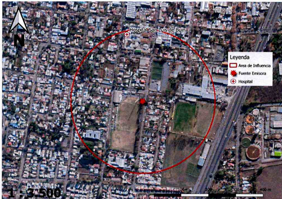
Imagen N° 1: Intersección de Área de Influencia y Hospital San Luis de Buin.