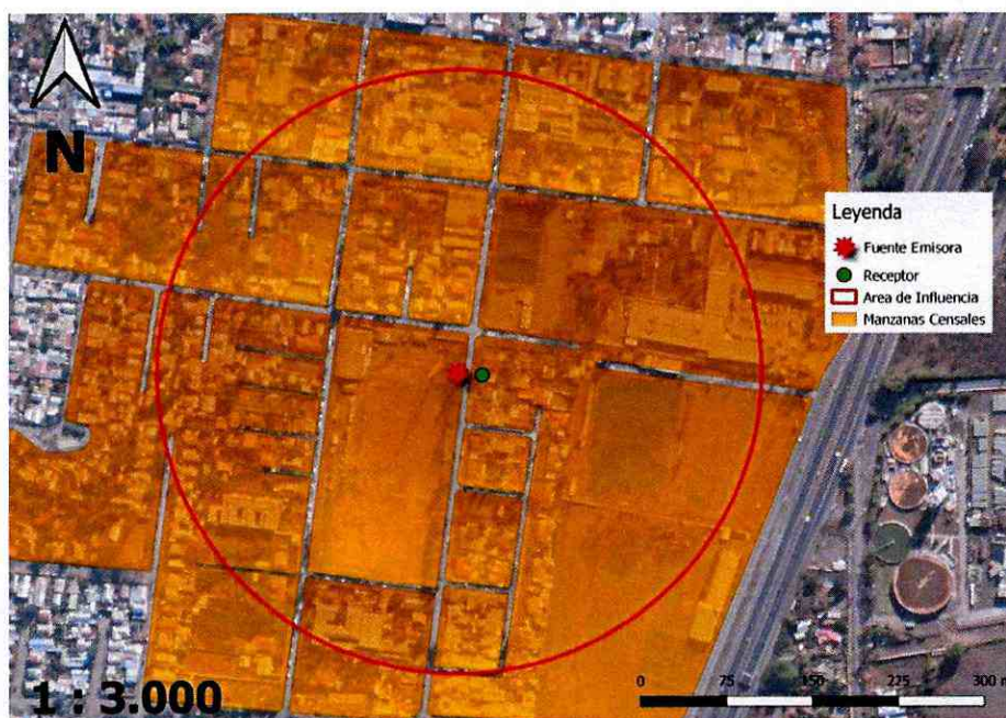
Imagen N° 2: Intersección manzanas censales y AI