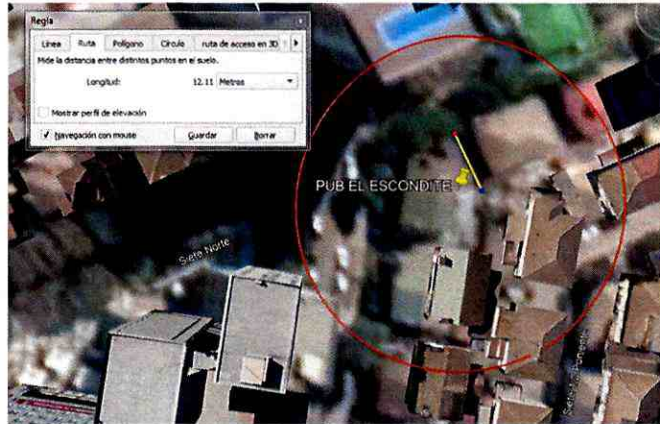
Imagen N°2: Medidas mínimas consideradas para el cálculo del Beneficio Económico; Aislamiento acústico de superficies vidriadas y construcción de muro colindante con denunciante.