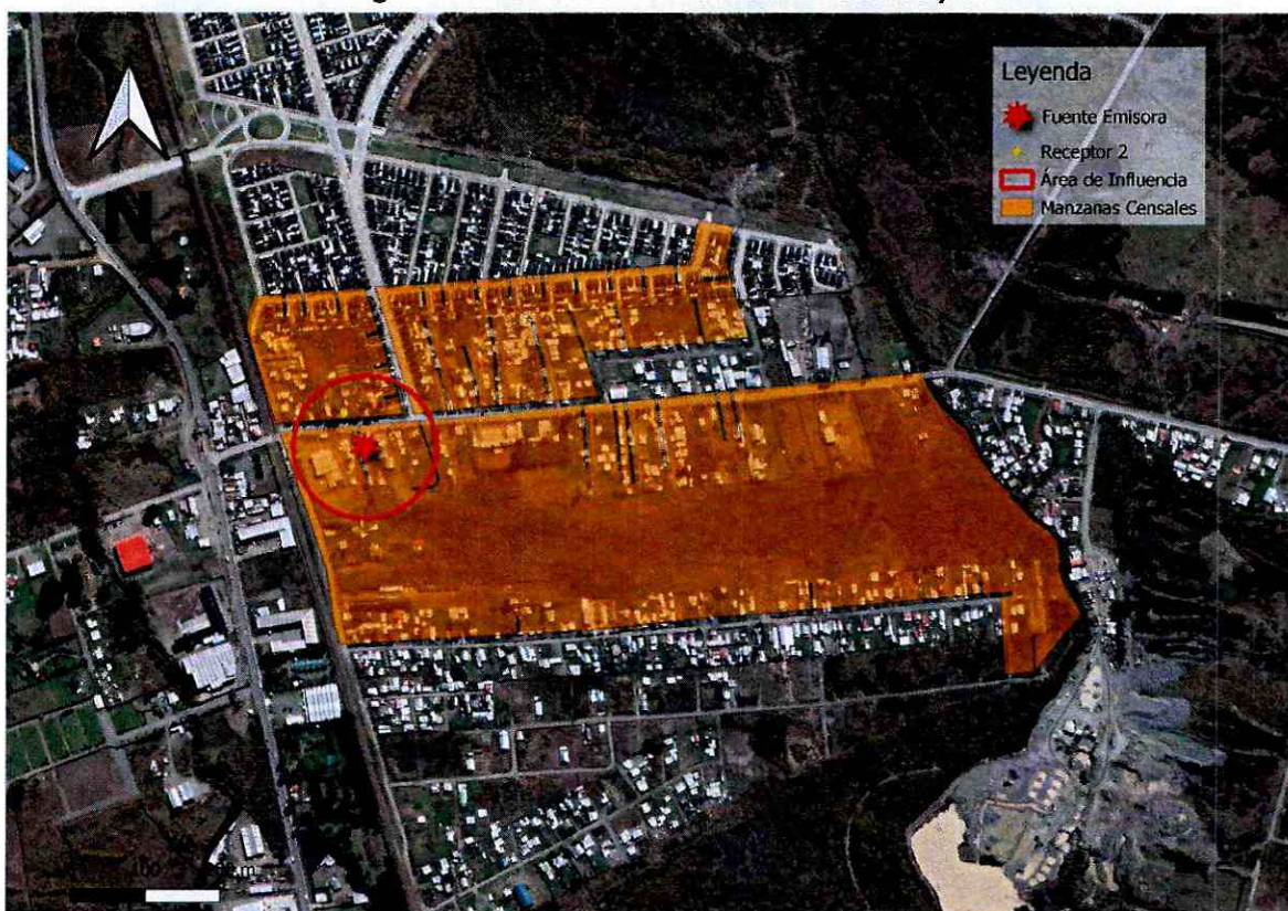
Imagen N° 1: Intersección manzanas censales y AI