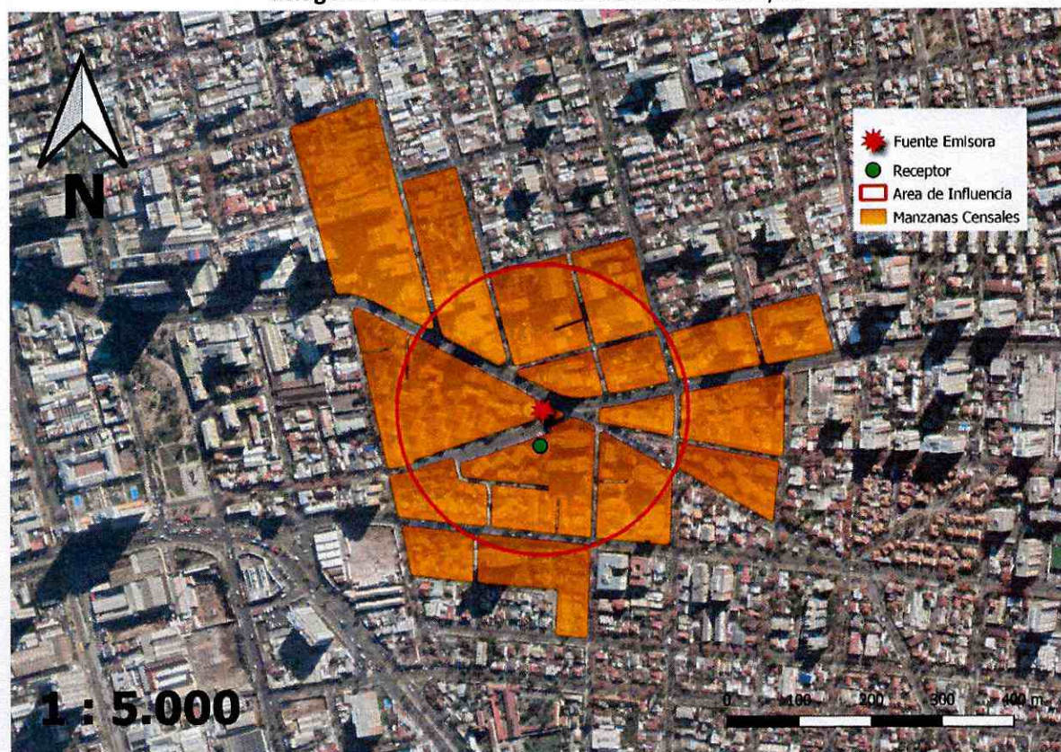
Imagen N° 1: Intersección manzanas censales y AI