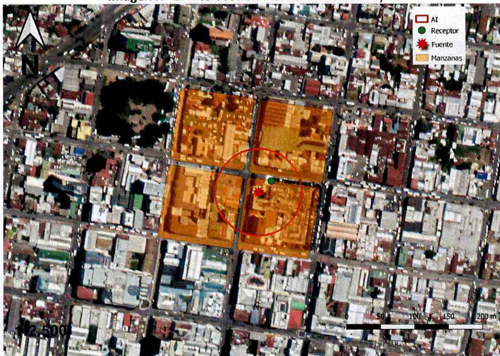
Imagen N° 1: Intersección manzanas censales y AI