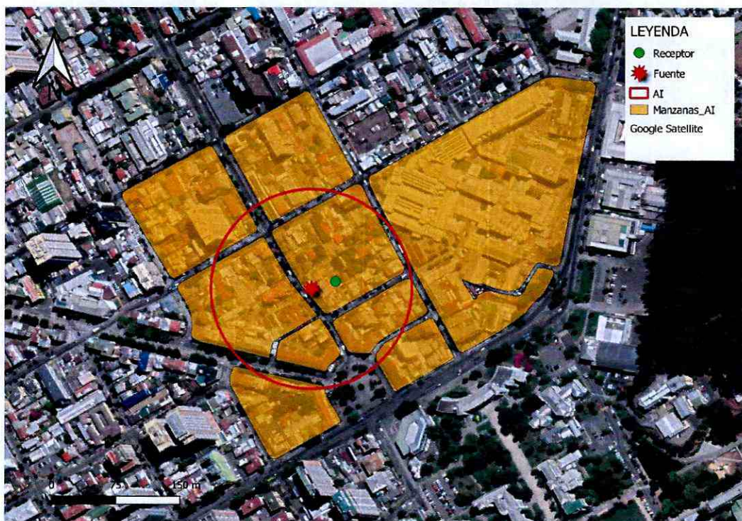
Imagen N° 1: Intersección manzanas censales y AI