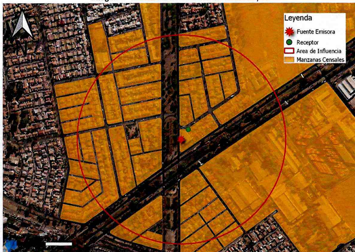
Imagen N° 1: Intersección manzanas censales y AI