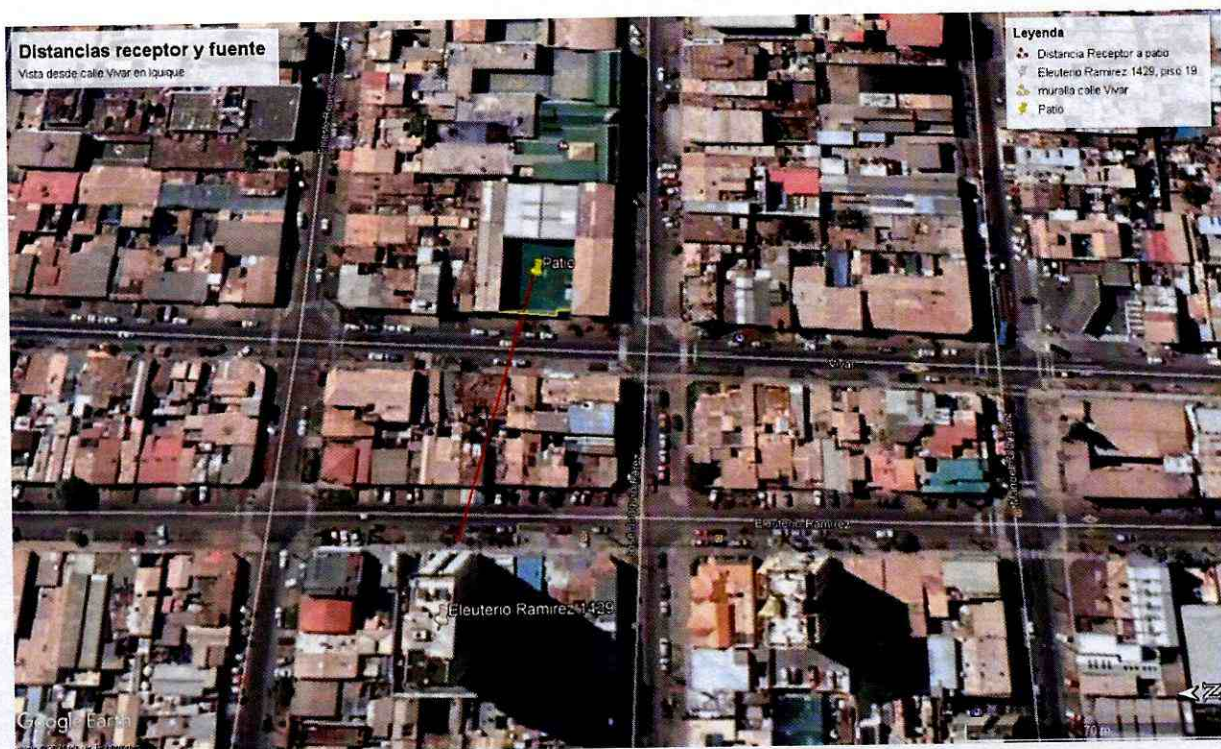
Figura N°1. Distancia entre receptor y patio del Lineo Maria Auxiliadora.

45. En relación a las medidas y costos señalados anteriormente cabe indicar que, las medidas seleccionadas como las más idóneas fueron propuestas en base a las características de la fuente emisora, en este caso, provenientes principalmente del patio del liceo que colinda con la calle Vivar en Iquique, y el receptor sensible ubicado en el piso 19 de la calle Eleuterio Ramírez 1429, de la misma ciudad, cuya altura estimada 14 sería de 66,5 metros aproximadamente, y la distancia lineal entre el patio del liceo y la entrada del edificio del receptor, estimada en aproximadamente 85,6 metros. Luego, la distancia desde el patio al receptor, dada por la hipotenusa, es de 108 metros aproximadamente. La siguiente imagen N° 1 muestra la distancia lineal en plano entre el patio del liceo y el edificio del receptor.