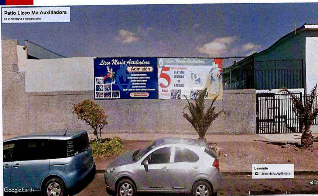
Figura N° 2. Muro que colinda con el patio del Liceo Maria Auxiliadora en calle Vivar.