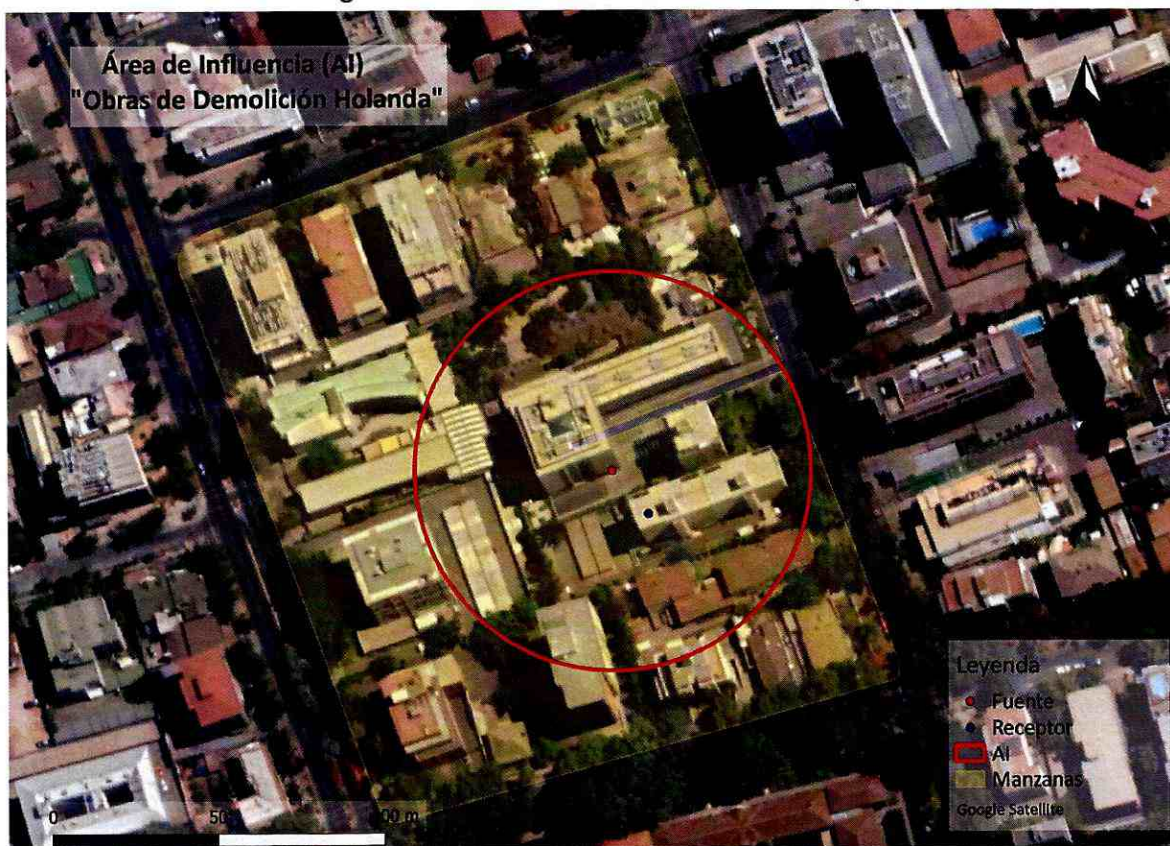
Imagen N° 1: Intersección manzanas censales y AI