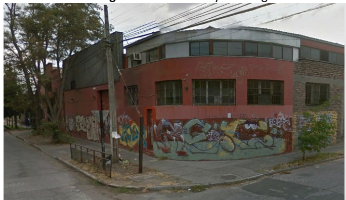
Imagen N°1. Vista Leroy Training

49. En relación a las medidas y costos indicados la Tabla N°4, cabe señalar que éstas consideraron el origen de las denuncias, las cuales dicen relación con gritos y música envasada. En virtud de lo anterior, se advierte que el recinto visualizado en Google Street View y representado en la imagen N°1 consta de una fachada de concreto, la que, por su naturaleza no requiere reforzamiento acústico; por tanto, se entiende que las medidas idóneas para volver al cumplimiento de la UF, dicen relación con: i) reforzar acústicamente todas las ventanas de la esquina del frontis del recinto deportivo, según se aprecia en la Imagen N°1, cuya exposición está en orientación el receptor sensible, instalando una segunda ventana de aluminio y vidrio común delante de las ventanas originales sin correderas 14 ; y, ii) instalar un limitador acústico para controlar la emisión de ruido desde los equipos de música. Respecto del costo del reforzamiento acústico de ventanas, se consideró un costo unitario de ventana estándar de $4,7/cm 2 según cotización singularizada en la Tabla N°4, asumiendo que el costo de las ventanas requeridas en este caso es el mismo. Así las cosas, el monto total por fabricación, flete e instalación de ventanas asciende a $1.499.097, equivalentes a 2,3 UTA. Finalmente, se referencia el costo de un limitador acústico para controlar la emisión de ruido de parlantes por un monto de $ 1.864.273, equivalentes a 2,9 UTA.