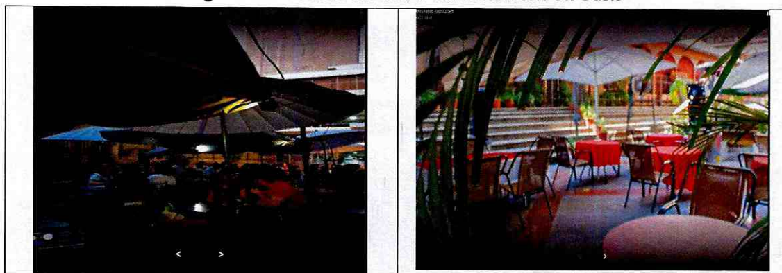
Imagen N°1. Vista de la terraza del restaurant Un Oasis