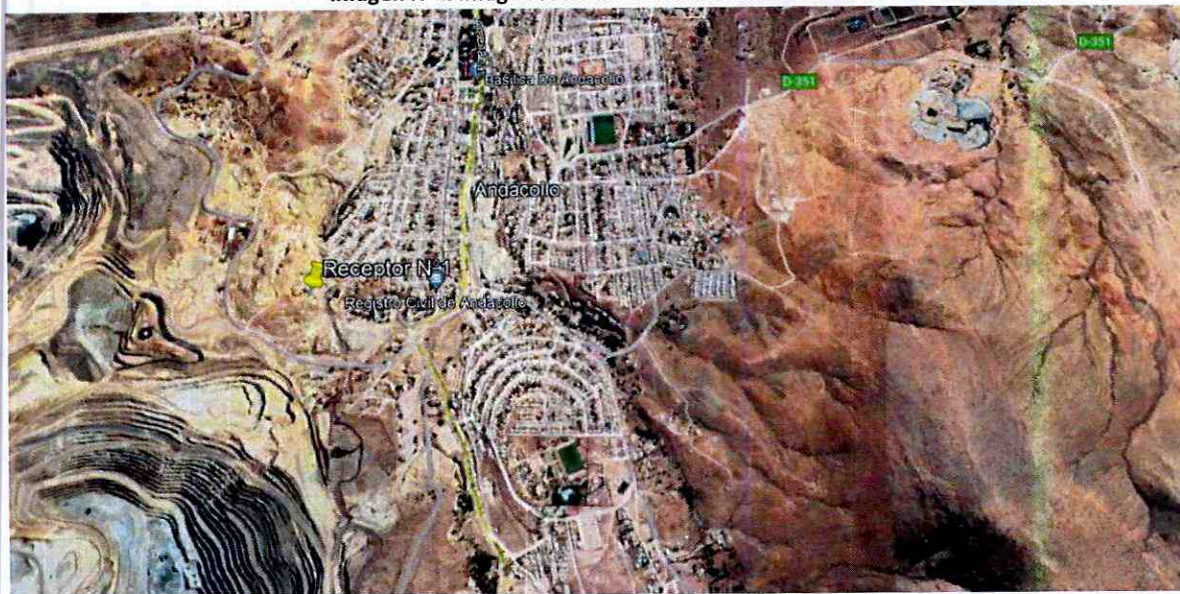
Imagen N°1: Imagen satelital Localidad de Andacollo.