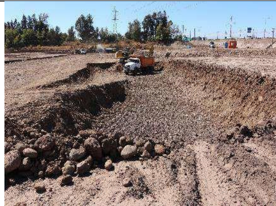
Figura 20. Nave 1 (14 de marzo de 2018).