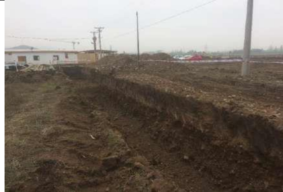
Figura 53. Excavación estanque de tratamiento de agua, Sector 9 (11 de julio).