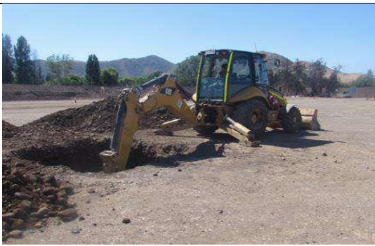
Figura 81. Trabajos de excavación fundaciones, Sector 8 (7 de noviembre).