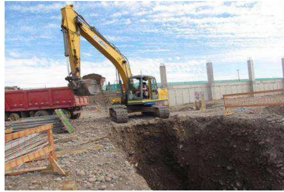
Figura 72. Trabajos de excavación zanja, Sector 3 (5 de octubre).