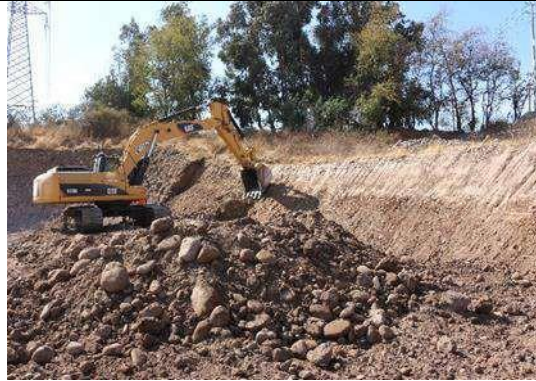
Figura 31. Perfilamiento norte (9 de abril de 2018).