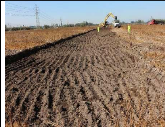
Figura 17. Inicio excavación primera nave (26 de febrero de 2018).

81. A continuación, se presenta una selección de imágenes representativas de los trabajos realizados durante la fase de construcción entre el 19 de febrero y el 28 de diciembre, ambos de 2018, las que han sido extraídas del “Informe Final De Monitoreo Arqueológico” recién citado.