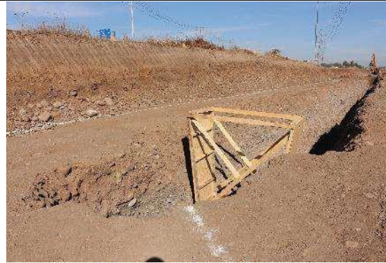
Figura 42. Excavación dren, Sector 1 y 2 (2 de mayo de 2018).