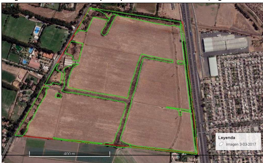
Figura 2. “Ambiente adecuado para reptiles” en el área de influencia, según Walmart.