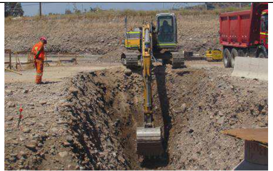
Figura 86. Trabajos de excavación de alcantarillado, Sector 6 (26 de diciembre).

82. Por consiguiente, las imágenes contenidas en el “Informe Final De Monitoreo Arqueológico” dan cuenta de los trabajos realizados durante la fase de construcción, entre el 19 de febrero y el 28 de diciembre de 2018, incluyendo excavaciones y escarpes en diferentes sectores del área de influencia.