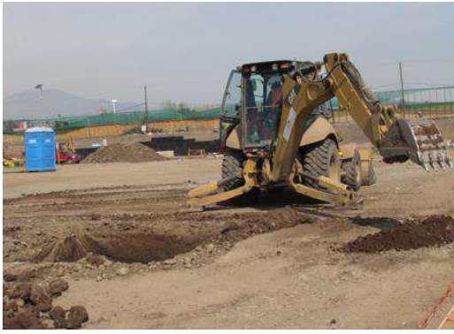
Figura 66. Trabajos de excavación de fundaciones, eje 9, Sector 7 (11 de septiembre).