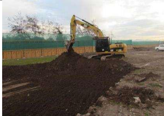
Figura 45. Escarpe Inicial edificación plataforma acceso sur, Sector 4 (4 de junio de 2018).