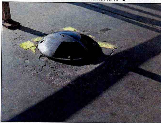
Ilustración 1. Luminaria N° 3

Fuente: Informe de Fiscalización DFZ-2019-2109-II-NE, Fotografía 6.