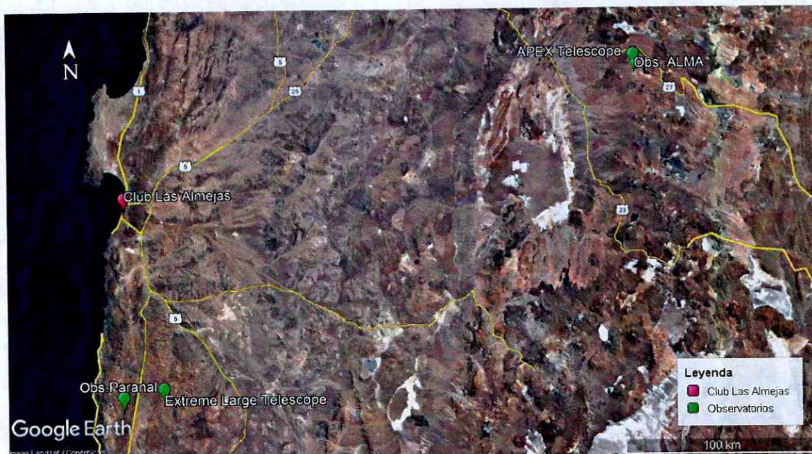
Ilustración 4. Ubicación geográfica de Cancha Las Almejas y observatorios astronómicos