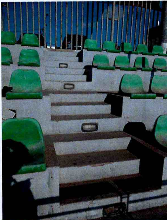
Ilustración 2. Luminaria N° 4