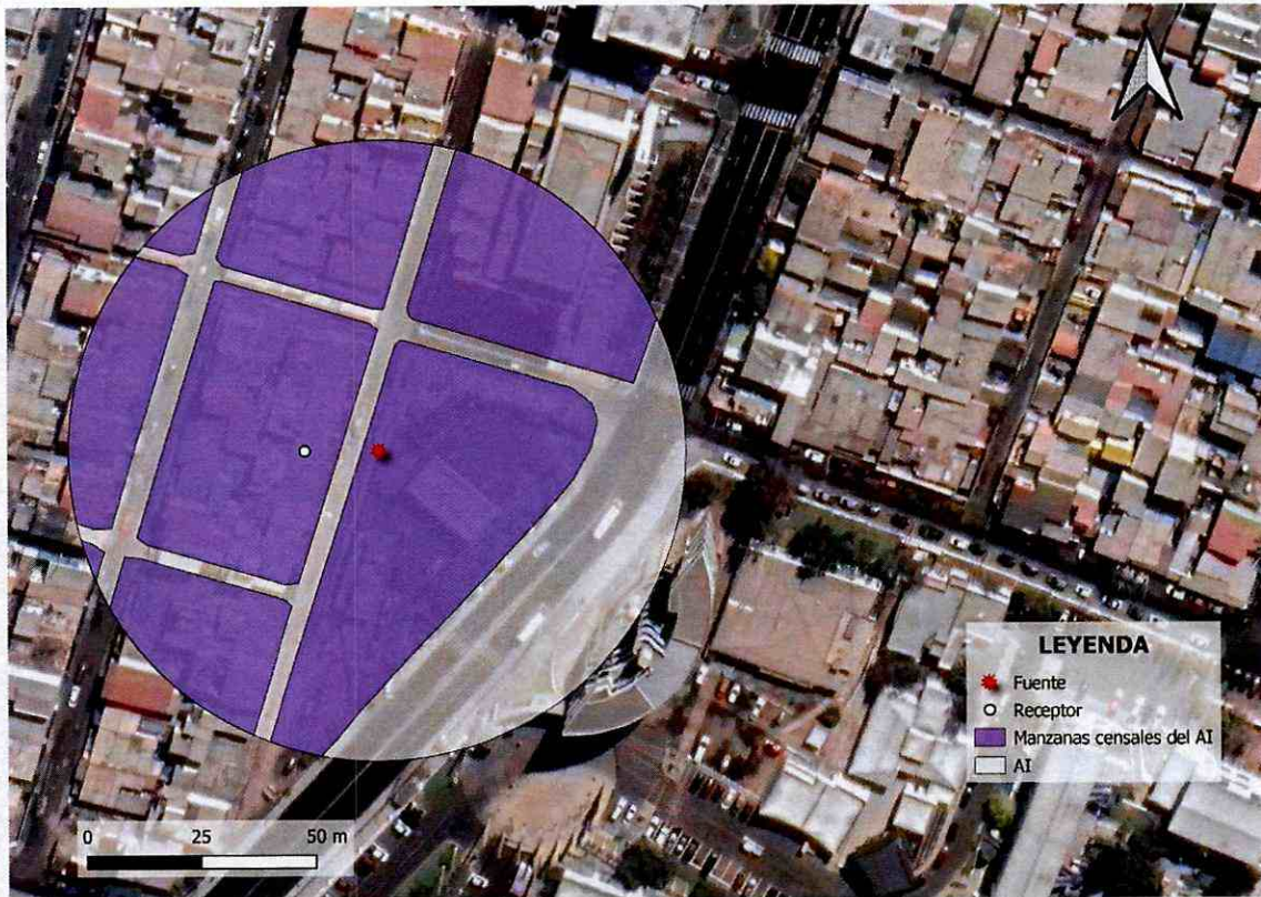
Imagen 1. Intersección manzanas censales y AI